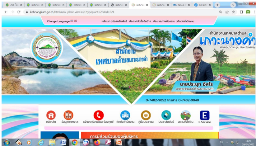
เว็บไซต์เทศบาลตำบลเกาะนางคำ